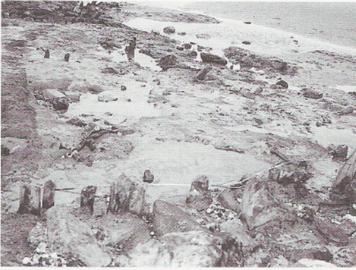
Paalfundering van een schuur in de havenbuurt van Westenschouwen.

Toen werd hem gevraagd lid te worden van de redactiecommissie van het Jaarboek. De commissie bestaat steeds uit vijf mensen, die de artikelen redigeren. In december worden er auteurs uitgenodigd om een artikel te schrijven. Er wordt gekozen voor wetenschappelijke en populair wetenschappelijke onderwerpen. Beekman publiceerde zelf o.m. in het Mededelingenblad, de Sterna en het Zeeuws Tijdschrift. Hij bleef de onderzoeker. Hij bestudeert en onderzoekt de geschiedenis van het landschap en de daarbij behorende ecologische processen. In 1990 vroeg professor Borger van de Universiteit van Amsterdam of hij zou willen promoveren. „Eigenlijk kan dat niet met mijn opleiding, maar omdat ik gevraagd werd kan dat wel. Ik was daar natuurlijk heel blij mee. Na mijn vijftigste kwam ik plotseling in de universitaire wereld terecht en ben onderzoeker geworden met 15 andere promovendi. Mijn onderwerp is de Schouwse duinen geworden. Ik verricht speurwerk in de archieven van het waterschap, de archieven van de Heren van